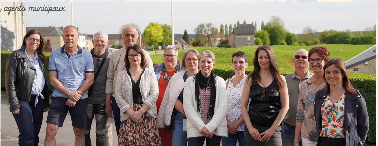
Les agents municipaux