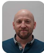
LIEBEAUX Sylvain Allées : Jonquilles, Muguet et Pervenches