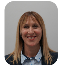
TEGUIG Sandrine Lotissements : Val Fleury, Corde et Chemin Leupierre

* Les secteurs sont créés dans un souci de proximité.