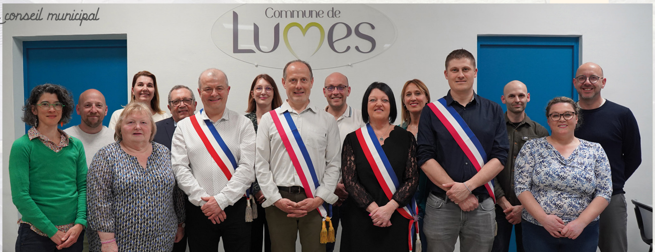
Le conseil municipal