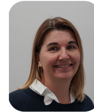
GUILLON Peggy Lotissements : Rult des Fourneaux et le Rucher